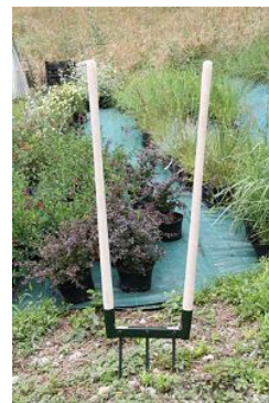
Grelinette met 3 tanden

Tijdens mijn cursussen vertel ik vaak over de grelinette (zie foto), een fantastisch stuk gereedschap waarmee ik in Frankrijk gedurende 13 seizoenen met veel plezier en naar volle tevredenheid heb gewerkt in de moestuin aldaar. Het maakt de bodem vrij diep los, zonder dat je hoeft te spitten. Goed voor de bodem en goed voor je rug.