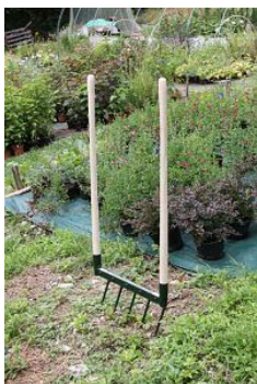
Grelinette met 5 tanden