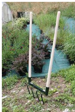
Grelinette met 4 tanden